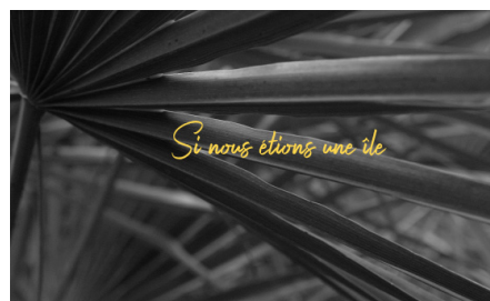
Si nous étions une île - 2019 Rôle: réalisation, cadrage, montage Lien: https://vimeo.com/479281616