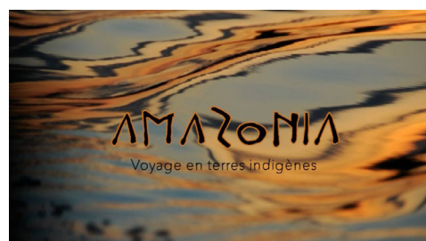
Documentaire - 52 et 75 min - 2017 Rôle: réalisation, cadrage, montage Lien: https://vimeo.com/199301666 (bande-annonce)