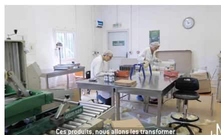
Portrait d'emprunteur: Éthiquable - 2018 Client: Banque La Nef Rôle: réalisation, cadrage, montage Lien: https://vimeo.com/336803253