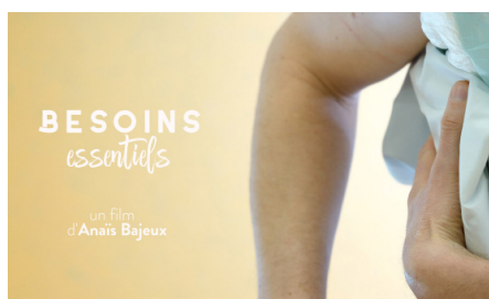
Besoins essentiels - 10 min - 2021 Concours Arte pour femmes réalisatrices Rôle: réalisatrice, cadreuse, monteuse Lien: https://vimeo.com/534031946