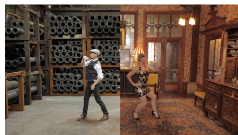
Back to black - 2019 Rôle: réalisation, cadrage, montage Lien: https://vimeo.com/349891944