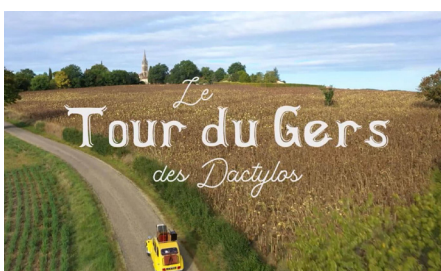
Documentaire - 20 min - 2019 Client: Compagnie de théâtre Oxymore Rôle: réalisatrice, cadreuse, monteuse Lien: https://vimeo.com/380544940