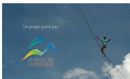
La montagne prend ses quartiers - 2020 Client: Association En Passant Par La Montagne Rôle: réalisation, cadrage, montage Lien: https://vimeo.com/475920757